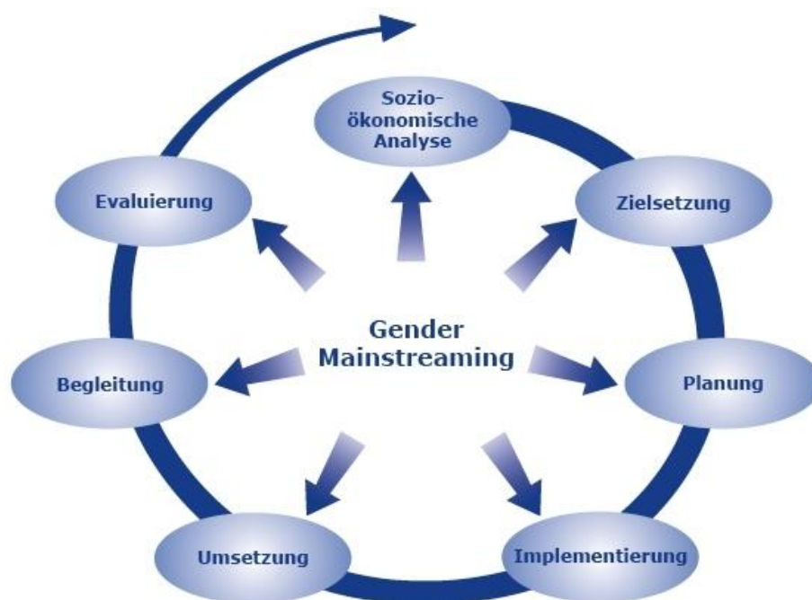
Abb. 2: Steuerungszyklus auf der Ebene des Operationellen Programms nach Meseke